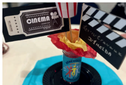
Lotbinière: Soirée cinéma