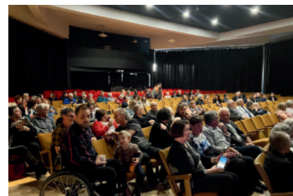
Bellechasse: Gala de reconnaissance