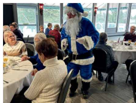
Photo prise lors du brunch de Noël