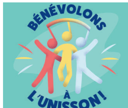
Promotion de la semaine de l'action bénévole 2023

Pour la 49e édition de la semaine de l'action bénévole , des actions de promotion dans les journaux locaux et en ligne ont été mises en place afin de reconnaître l'implication essentielle des bénévoles. Nous avons aussi facilité les commandes de matériel promotionnel pour nos organismes membres, et participé à l'organisation de divers activités de reconnaissance pour les bénévoles.