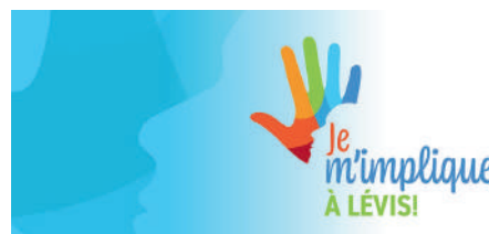
La journée internationale des bénévoles

Cette année, pour la 38e édition de la Journée internationale des bénévoles qui a eu lieu le 5 décembre 2023, nous sommes passés par différents outils de promotion pour faire savoir aux bénévoles de Lévis notre appréciation. Nous avons donc mis en place plusieurs actions de promotion durant cette journée pour souligner et remercier l'implication bénévole des citoyens lévisiens.